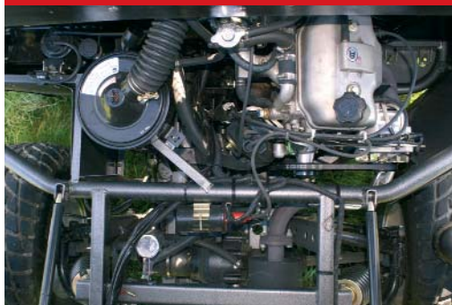
UTV-Unikat: Zweizylinder-Motor mit Viergangschaltung.

Borossi Motors LTD Wenzendorfer Str. 9 21244 Buchholz Tel.: +49/(0)4181/2184-30 www.borossi.de