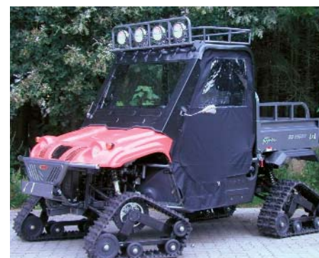
Volles Programm: Die Chinesen decken mit Ihrer Produktion jede Nische ab.