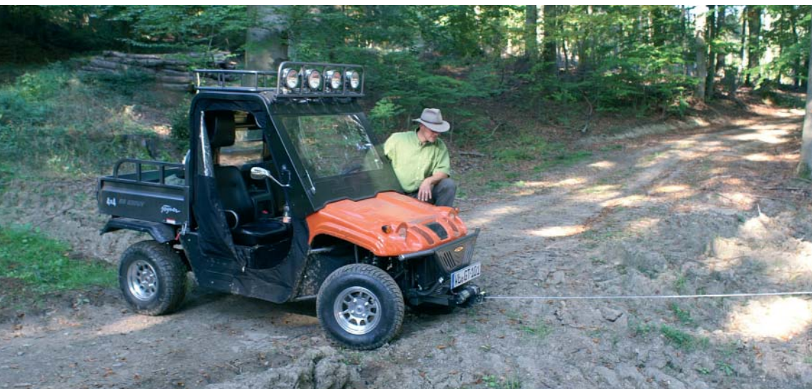
Einsatzbereit: Der Geräteträger bietet viele Möglichkeiten. Hier nimmt er die Seilwinde auf.

schützt vor Dreck und Ästen im Gelände. Optional ist ein Scheibenwischer erhältlich. Einziges Manko der Vollausstattung: Bullenhitze bei Sonnenschein. Damit empfiehlt sich die Kabine als Schlechtwetterlösung. Aber schon das Basismodell kommt interessant daher. Pulverbeschichteter Rahmen und Ladefläche sowie die komplette Elektrik mit wasserfesten Superseal Steckern. Die Straßenzulassung gibt's in der "onroad" genannten Version obendrein. Fahrbereit wiegt das UTV 620 Kilo. Das sind gleich 105 mehr als Yamaha's Rhino. Zuladen darf man je nach Version bis zu 600 Kilo. In der zugelassenen Variante immerhin 400. Ein Topp-Wert in der Klasse, der nur vom Kubota übertroffen wird. Den Unterschied machen die homologierten Reifentypen. Die freizeitorientierten Aspiranten bringen es auf weniger als die Hälfte der Zuladung. Etwas träge zieht das Fahrzeug an. Der erste Gang ist sehr kurz übersetzt. Gedacht ist er als reiner Geländegang. Einmal in Schwung, erreicht der Chinese aber locker seine Endgeschwindigkeit von knapp 70 km/h. Im Gelände hilft der zu-