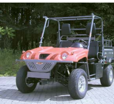
Mach dich nacklich: Borossi im Serientrimm ohne Anbauteile und Zubehör.

den Zustand des grade befahrenen Untergrundes. Die Bodfreiheit ist gut, Antriebseinheit und Motor liegen geschützt in der Rahmenkonstruktion. Ist auch das Design leicht an den Rhino angelehnt, so verfolgt Borossi tatsächlich einen eigenen Weg im UTV-Segment. Über die gefundenen Schwächen tröstet der absolute Knallerpreis von rund 7.700 Euro etwas hinweg. Den Joyner behalten wir jedenfalls im Auge und stellen ihn bald einer größeren Herausforderung. Wie seinerzeit den Rhino während unserer Alpenpassage. ■