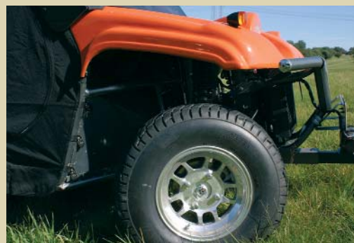
Schick auf die Gass: Alu-Felgen der Straßenversion.

schaltbare Allradantrieb weiter. In dieser Fahrstufe schafft das Gerät durchaus auch steilere Streckenabschnitte. Das Getriebe schaltet sich hakelig. Die optisch zwar netten Alu-Felgen und die Straßenbereifung sind für den Off-Road-Fahrer wenig empfehlenswert. Schon auf leicht feuchten Waldwegen sitzt das Profil schnell zu. Hier empfehlen wir die optionalen Stollenreifen. Gleichzeitig schiebt der Joyner stark über die Vorderäder. Daran hat sich der Fahrer zu gewöhnen. Der Wendekreis ist ebenfalls größer als der der Konkurrenz. In engen Kehren mussten wir öfters zurück set-