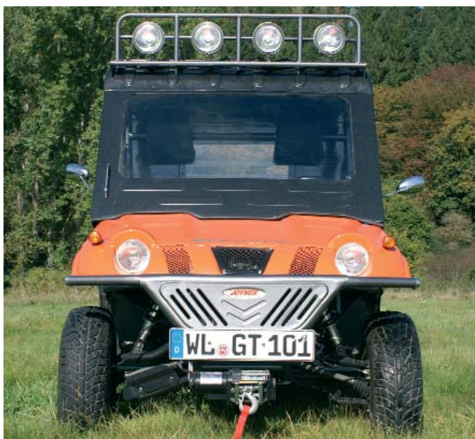
Testfahrzeug: Wir fahren den Borossi in "Onroad"-Version mit Kabine und Dachgepäckträger.