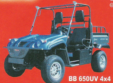
BB 650UV 4x4

Buggies & UVs bis zu 1600 ccm / 4 Zyl., mit Strassenzulassung!