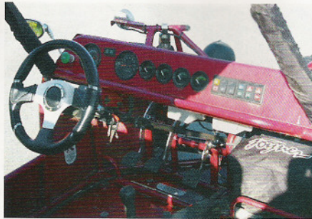
Informationsgesellschaft: Die Instrumente lassen keine Wissenslücken.