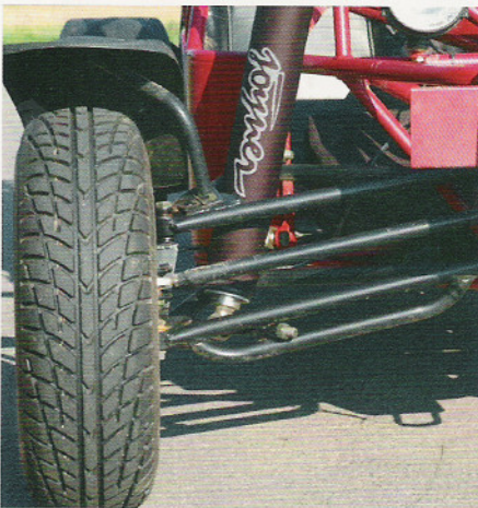
Macht sich breit: Fahrwerks-Set-Up für verschiedene Einsätze ist möglich.

Im Stadtverkehr kann man sich den vierten Gang sparen. Dafür ist es umso lustiger, die verdutzten Passanten zu beobachten. Für das Modelljahr 2008 hält