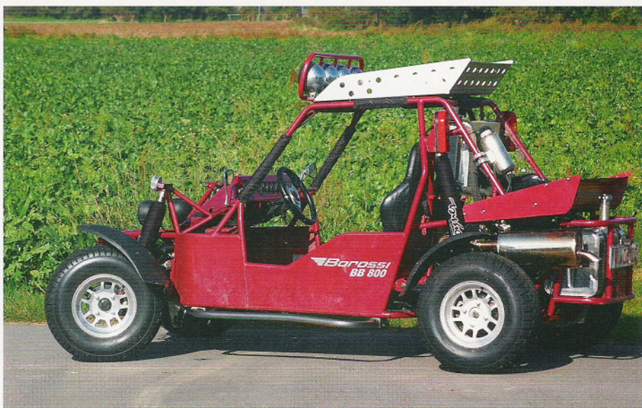
Sportlich: Mit PKW-Technik und Rennoptik findet der Borossi sicher Fans.

lig, wie bisweilen in einem Automatik-Buggy. 70 Newtonmeter sind eine Hausnummer. Stets kommt von hinten Druck und treibt den kantigen Boliden voran.