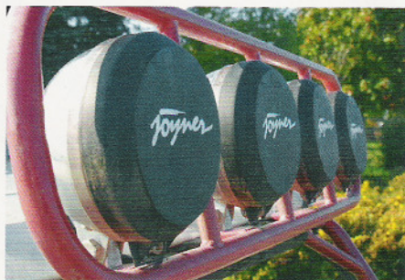
Rally-Optik: Lampenbatterie auf dem Dach.

Borossi jetzt einen pulverbeschichteten Rahmen bereit. Neu ist auch der polierte Edelstahl-Kraftstofftank. Auch der 4-Ventil Motor mit DOHC wurde nochmals überarbeitet und erhält einen größeren Alukühler. Die komplette Elektrik ist ab jetzt mit wasserdichten Superseal Steckern verlegt.