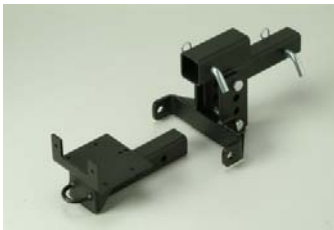
Universal Anbaukit Best Nr: 10260 € 239,-

Nach Installation des speziell entwickelten Anbaukits können Sie eine Vielzahl von Arbeitsgeräten ohne weiteres Werkzeug mit wenigen Handgriffen an Ihrem Borossi UTV montieren. Dazu gehören u.a. auch Streugeräte, diverse Bodenbearbeitungsgeräte, Vorlauf- und Nachlaufmäher sowie Rotationsbürsten. Wir beraten Sie gerne bei der Auswahl des optimalen Anbaugerätes.