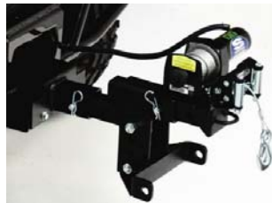
Seilwinde 3000lbs € 179,- (montiert auf Anbaukit)