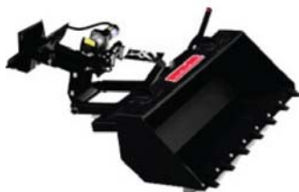
Arbeitschaufel Best. Nr: 15714 € 549,-