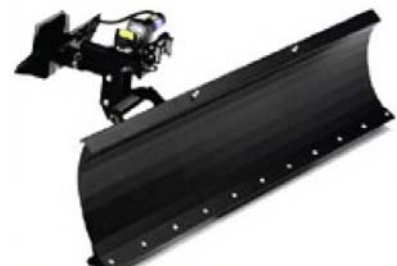
Schneeschild Best. Nr. 2140 € 499,-